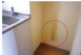
冷蔵庫の後部壁面の黒ずみ(電気ヤケ) 通常の使用による損耗⇒ 貸主負担