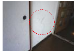
壁への落書き等の故意による毀損⇒ 借主負担