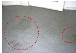
飲み物等をこぼしたことによるカーペットのシミ 手入れ不足等で生じたもの⇒ 借主負担