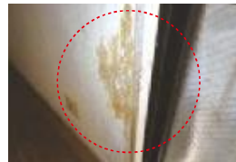
飼育ペット等による柱等のキズ⇒ 借主負担