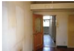
壁のタバコ等のヤニ 通常の使用による損耗を超える⇒ 借主負担